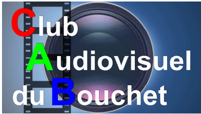
PHOTO - CINEMA - VIDEO